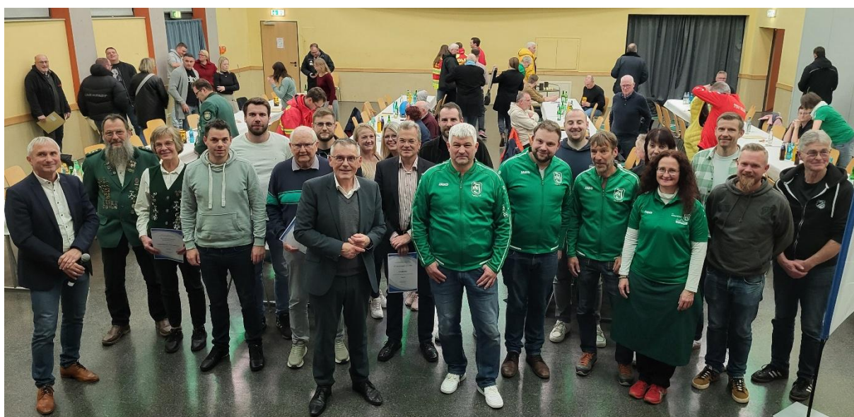
16 Vereine aus dem Altkreis Hofgeismar erhielten Förderbescheide