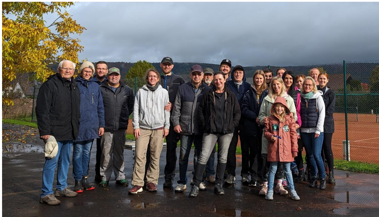
28.10.2023: Einwintern der Anlage mit diesen Helfern

Die Plätze müssen nach Frühjahrsinstandsetzung im KW 14 zwei Wochen gewalzt und gewässert werden. Danach treffen wir uns am Samstag, 20. April um 11:00 Uhr zum Auswintern. Die Netze werden aufgehängt, die Windsegel gespannt, sowie die Bänke und Stühle gereinigt und aufgestellt.