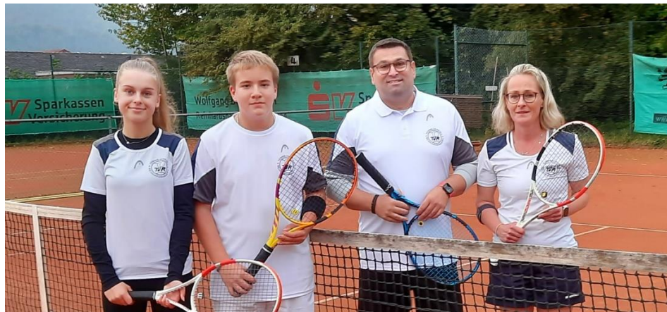
Endspiel im Mixed-Doppel fand am 09.10.23 statt