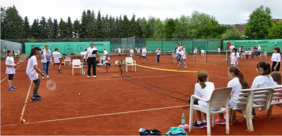
Hier ein Foto vom Juni 2016