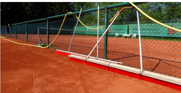
Fa. Oehl hat uns die neuen Abziehbesen zusammengebaut, danke