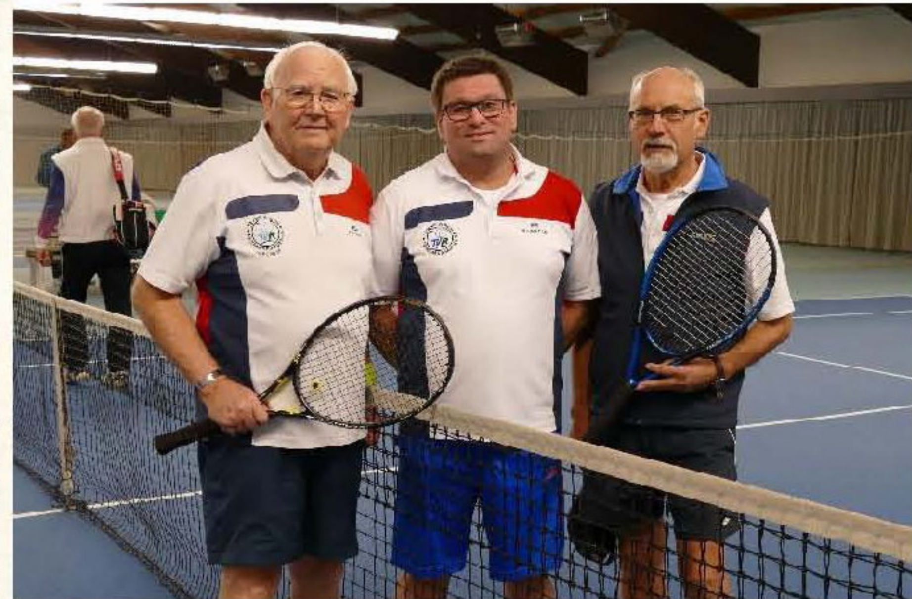
Teilnehmer des TVR an diesem Turnier