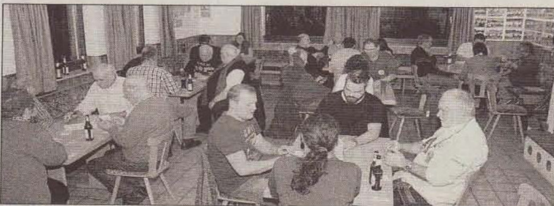
An 7 Tischen spielen 28 Spielerinnen und Spieler